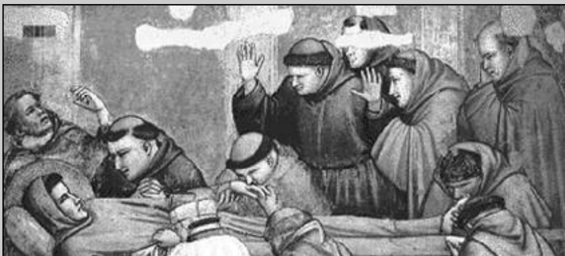
Shab San Frangisk fil-mument tat-transitu tiegħu fil-Porziuncola

Madwar l-1260 il-Klarissi hallew San Damiano biex jittrasferixxu ruħhom fil-knisja ta' San Giorgio, fejn kienet indifnet Klara. Kien x'aktarx f'din iċ-ċirkustanza li Leone u Angelo taw lil swor Benedetta, l-ewwel badessa tal-protomonasteru ta' Santa Klara, il-brevjar ta' San Frangisk biex jithares hemmhekk b'tifkira u devozzjoni lejn il-missier imqaddes. Il-manuskritt, li sallum għadu mhares fil-protomonasteru ta' Santa Klara, fih diversi partijiet miktubin minn idejn differenti. Imma l-veru brevjar, li hu l-parti l-aktar qadima tal-manuskritt, jidher miktub bejn l-1216 u l-1223 minn kappillan tal-kurja rumana; mal-brevjar hemm miżjud l-evangeljarju, li juri influssi tal-liturgija gallikana. Il-brevjar fih ukoll salterju miktub minn amanwensi minn Bologna. Mill-id ta' fra Leone haġu xi korrezzjonijiet, li inkitbu wara l-